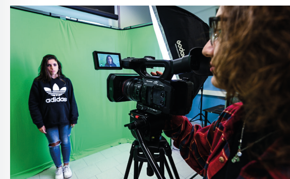
Audiovisivo e Multimediale